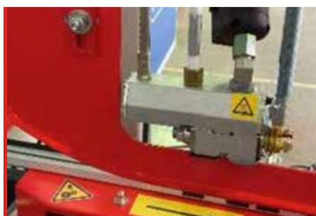
Cierre con Hot Melt (OPCIÓN)